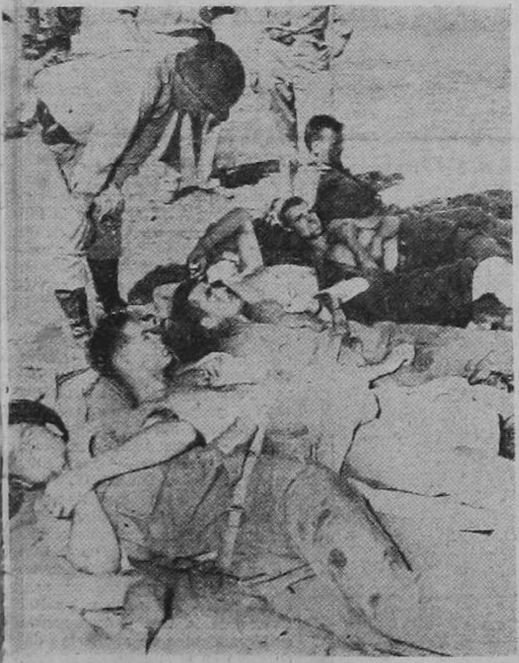
El Tte. Gen. George S. Patton habla con heridos estadounidenses del frente italiano que esperan su traslado a los hospitales del norte de África.