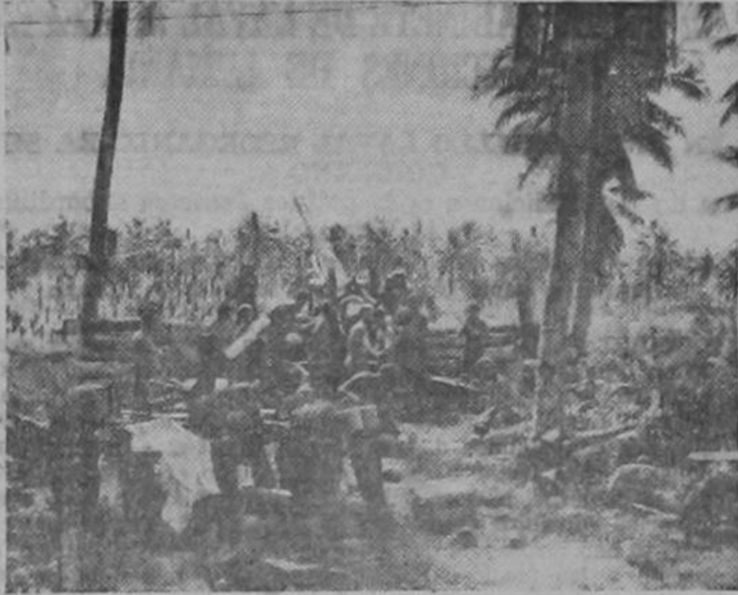
Soldados de infantería de marina de los Estados Unidos disparan un cañón de 15.5 cm. en una isla del suroeste del Pacífico en la campaña para destruir las bases japonesas de ese sector. Las redes de mimetismo, que se confunden con el follaje, contribuyen a ocultar el arma.