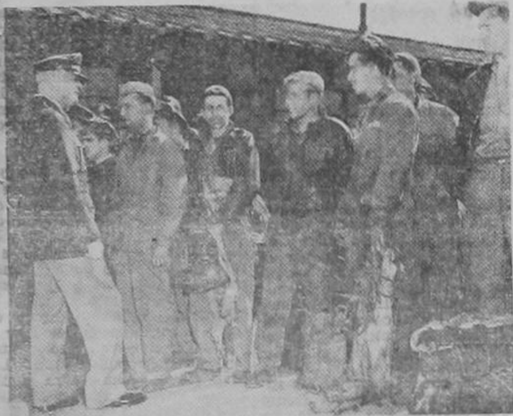
El general Henry H. Arnold, jefe de las fuerzas aéreas del ejército de los Estados Unidos, conversa en una base de Inglaterra con pilotos de bombarderos a su regreso de una incursión a pleno día sobre Alemania. A pesar de la desesperada resistencia de los nazis los bombarderos llevan la destrucción a la industria de guerra alemana con sus ataques diurnos y lo certero de sus bombas.