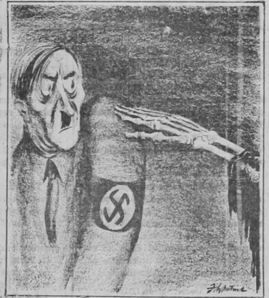
Fitzpatrick en el St. Louis Post-Dispatch.